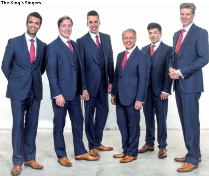
The King's Singers

Kartenvorverkauf Tourist-Information Tel. +49 (0)751 405 232 und www.reservix.de Karten zu € 32 / 28 / 24 / 20 Veranstalter: Kulturkreis Weingarten