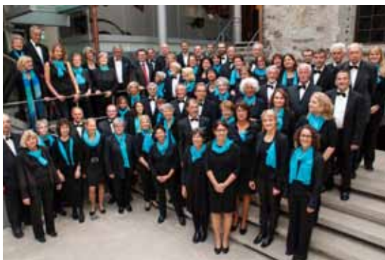
Oratorienchor- Liederkranz Ravensburg

Das Konzert wird vom SWR aufgenommen und zu einem anderen Zeitpunkt gesendet.