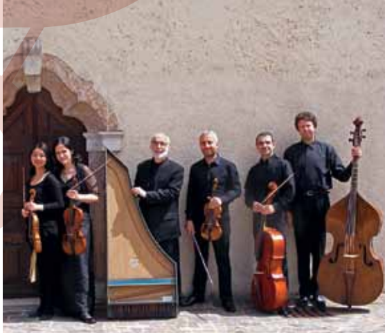
Lorenzo Ghielmi und das Ensemble La Divina Armonia